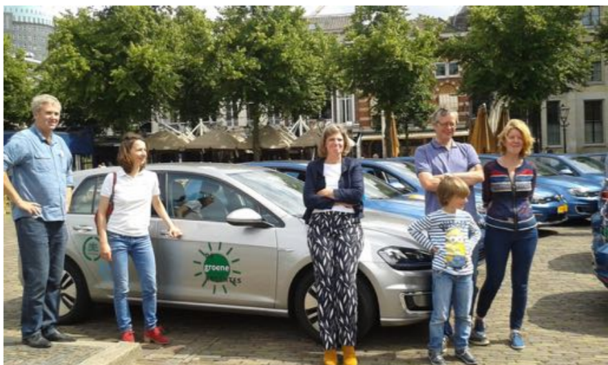
Buurtvereniging de Groene Regentes delen de auto met bewoners van de Regentessewijk